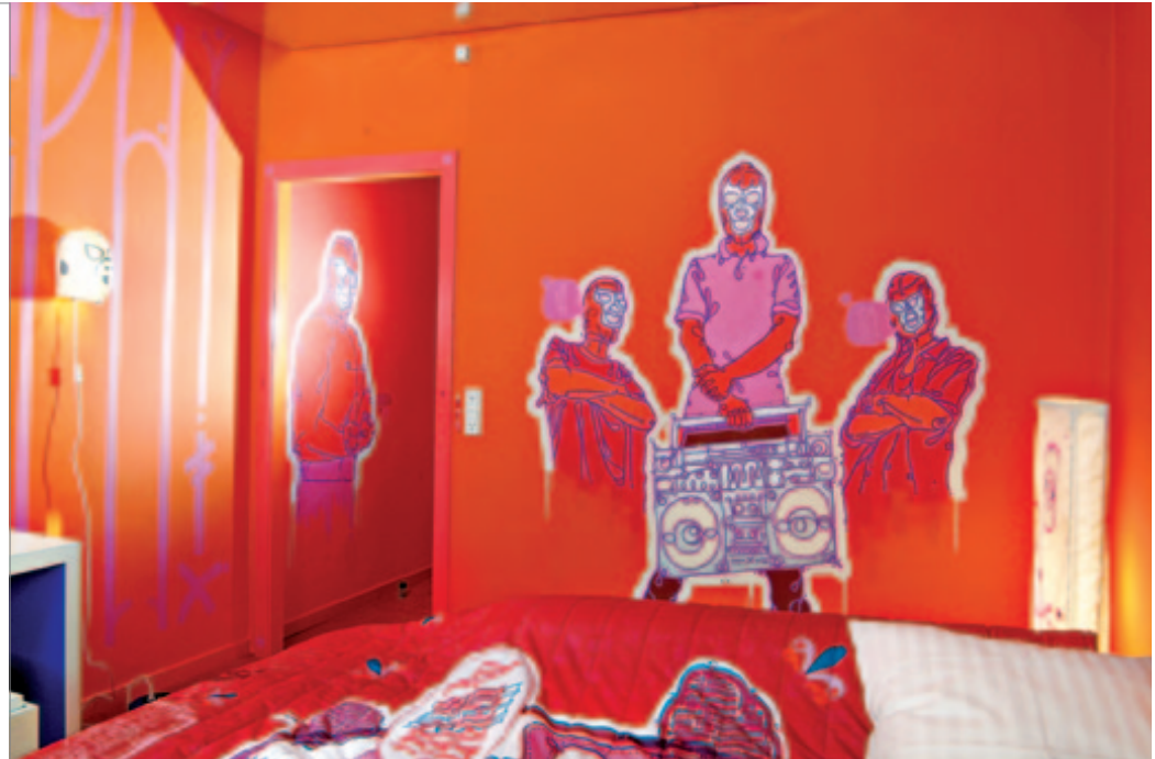
Комната с красным потолком